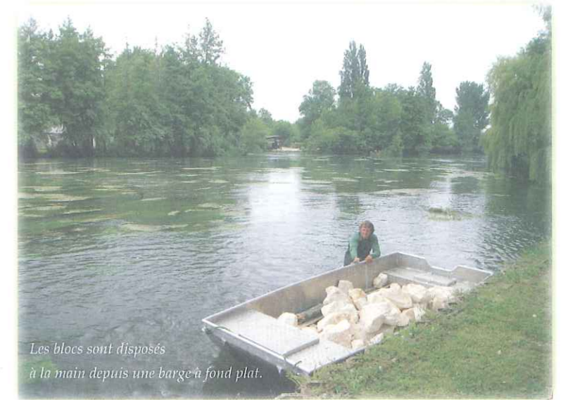
Les blocs sont disposés à la main depuis une barge à fond plat.

Ils auront aussi pour but de recréer un lit plus adapté aux conditions de débit d'étiage, prolongeant dans le temps un courant préférentiel par rétrécissement de la largeur d'écoulement. L'ensemble des actions projetées seront réalisées, comme pour l'entretien de la végétation rivulaire, entre fin août et début novembre, afin d'éviter les périodes de reproduction, de nidification ou de frai. Ces actions seront encadrées par l'ensemble de nos partenaires techniques, à la fois institutionnels et associatifs.