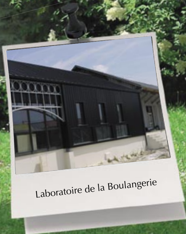
Laboratoire de la Boulangerie