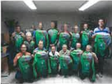
Le Bureau du Cyclo Club Tolvérien

Sur cet excellent résultat, nous remercions nos sponsors et la Municipalité pour leurs aides. Nous vous souhaitons une bonne année 2017 et n'hésitez pas à nous contacter si vous souhaitez parcourir et découvrir les routes en notre compagnie.